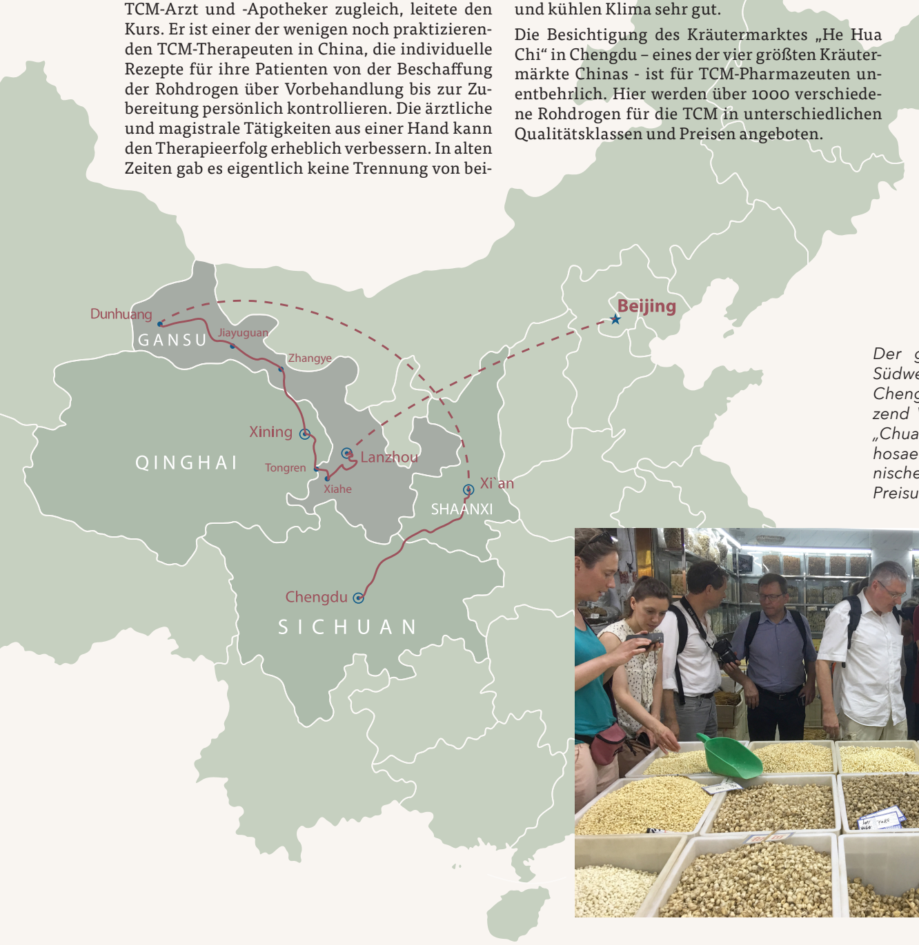
Der größte TCM-Kräutermarkt Südwestchinas – Hehua Chi in Chengdu. Das Foto zeigt ein Dutzend Varianten der TCM-Droge „Chuan Bei Mu“ ( Fritillariae cirrhosae bulbosae ) von diverser botanischer Herkunft mit erheblichen Preisunterschieden.

Die Besichtigung des Kräutermarktes „He Hua Chi“ in Chengdu – eines der vier größten Kräutermarkte Chinas – ist für TCM-Pharmazeuten unentbehrlich. Hier werden über 1000 verschiedene Rohdrogen für die TCM in unterschiedlichen Qualitätsklassen und Preisen angeboten.