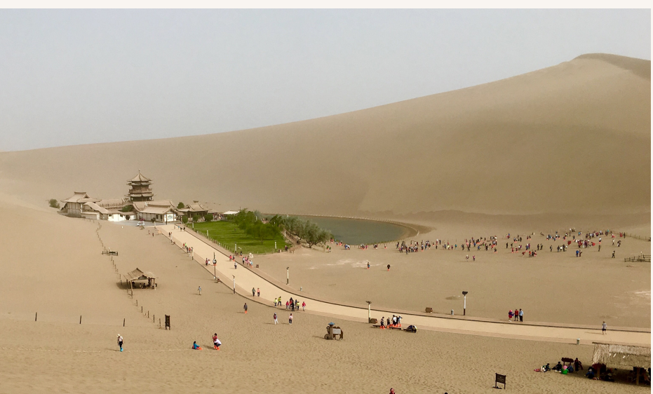
▼ Der Mondsichelsee – eine Oase in der Nähe von Dunhuang